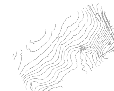
Altimetria 2 x 2 m