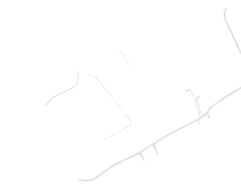
Rede viária e outras construções lineares